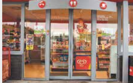
Segurança discreta e estética