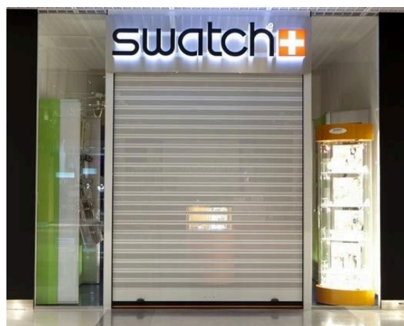
Mod. MICROBAIX anodizado Plata Mate