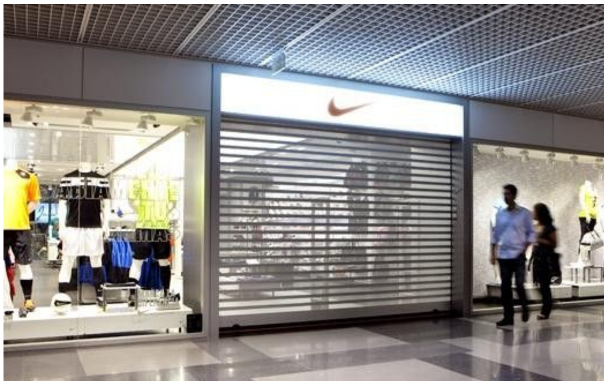
Mod. MICROBAIX anodizado Prata Mate